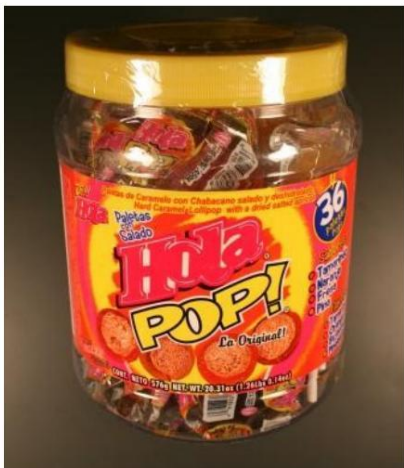
Hola Pop La Original Lollipop

Dulces retirados del mercado el 2 de mayo de 2009