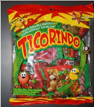
Dulces Ticorindo Retirado el 31 de diciembre de 2009

Foto de Candy / Nombre y enlace del comunicado de prensa