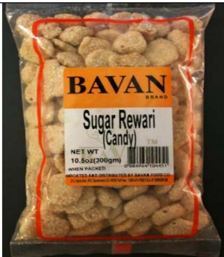
Azúcar Rewari de la marca BAVAN Importado de la India Retirado el: 30 de junio de 2011

Foto de Candy / Nombre y enlace del comunicado de prensa