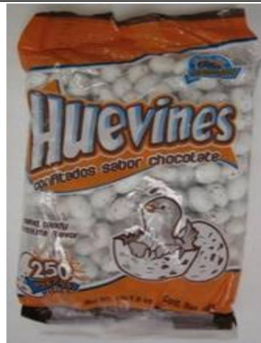
Huevines Confitados Sabor Chocolate

Dulces retirados del mercado el 2 de mayo de 2009