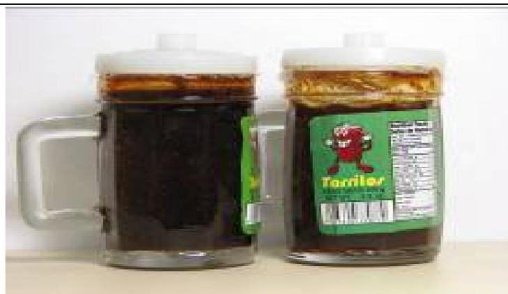
Tarritos, snack de caramelo líquido