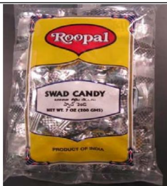
Caramelos Roopal Swad / de la India Retirado el: 18 de noviembre de 2011

Foto de Candy / Nombre y enlace del comunicado de prensa