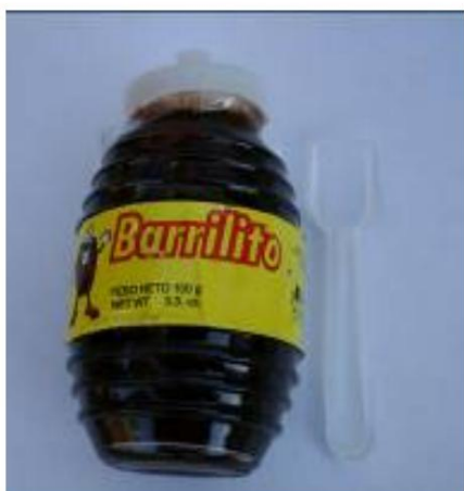
Barrilito Retirado el: 22 de agosto de 2007

Foto de Candy / Nombre y enlace del comunicado de prensa