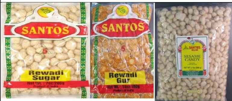
Dulces Santos de la India: Azúcar Rewadi Recordado el: 13 de septiembre de 2013 y Rewadi Gur, y Santos Sesame Dulces retirados del mercado el 7 de octubre de 2013