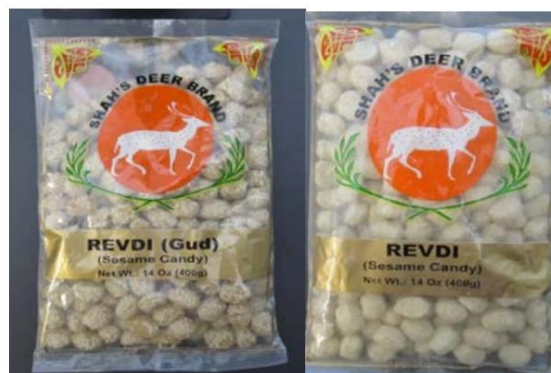
Shah's Deer Brand Revdi (Gud) (dulces de sésamo) y Shah's Deer Revdi (dulces de sésamo) de India Ambos dulces fueron retirados del mercado el 5 de marzo de 2012

LA INFORMACIÓN CONTENIDA EN ESTE DOCUMENTO ESTÁ SUJETA A CAMBIOS FRECUENTES SIN PREVIO AVISO. Esta información es válida únicamente a partir de la fecha de "Última actualización" que figura en la parte superior de la página, y solo hasta la próxima actualización. Las medidas de cumplimiento adoptadas únicamente con base en la información contenida en este documento podrían no ser válidas.