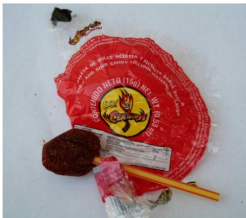
Indy Cerillos, sabor sandía. A partir del

19/12/07, este dulce con un código de lote de dos líneas puede venderse en California. Por ejemplo: 522110711 221108. Retirado