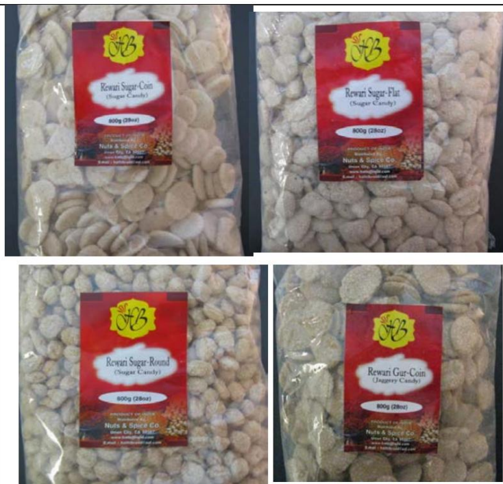
HB Rewari: Monedas de azúcar, Azúcar plana, Azúcar redonda y Dulces Gur-Coin (Dulces de Jaggery)/ Todo importado de la India Retirado el: 23 de febrero de 2012

LA INFORMACIÓN CONTENIDA EN ESTE DOCUMENTO ESTÁ SUJETA A CAMBIOS FRECUENTES SIN PREVIO AVISO. Esta información es válida únicamente a partir de la fecha de "Última actualización" que figura en la parte superior de la página, y solo hasta la próxima actualización. Las medidas de cumplimiento adoptadas únicamente con base en la información contenida en este documento podrían no ser válidas.