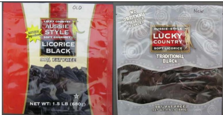
Paquete antiguo Paquete nuevo Regaliz suave Lucky

Country "estilo australiano" "negro tradicional" 98 % libre de grasa Vigente a partir del 17/10/2012: este dulce en un nuevo paquete "gris" está permitido para su venta en California.