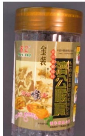
Chayote Jigong Retirado el: 23 de octubre de 2009