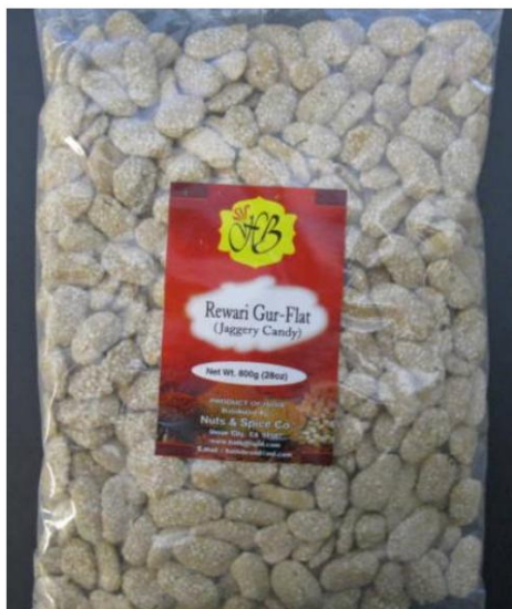
HB Rewari Gur-Flat (Dulce de Jaggery)/ de la India Retirado el: 16 de febrero de 2012