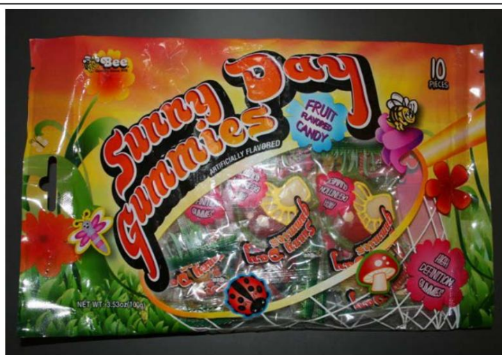
Gomitas Bee Brand Sunny Day Retirado el: 1 de diciembre de 2011