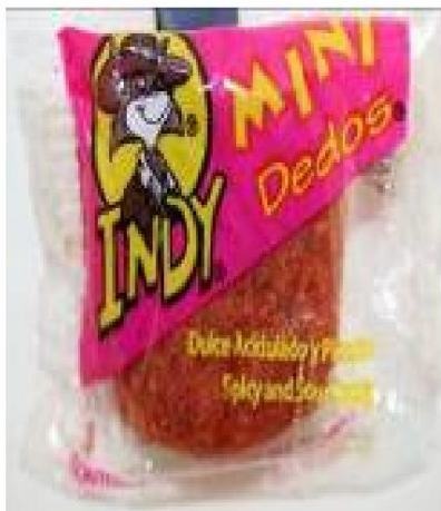
Indy Mini Dedos Picantes y Ácidos Retirado el: 18 de enero de 2008

Foto de Candy / Nombre y enlace del comunicado de prensa