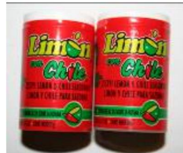
Lucas Limón y Lucas Limón con Chile. Nota: El fabricante ha descontinuado estos productos. Retirados del mercado el 9 de mayo de 2007.