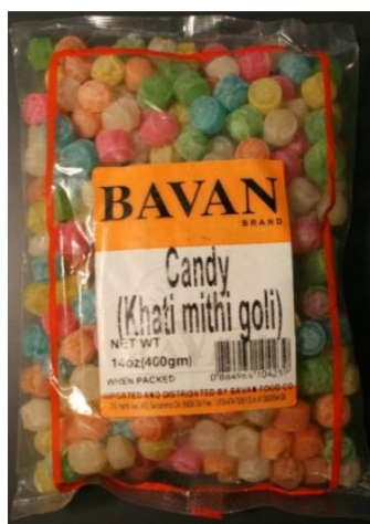
BAVAN Brand Santra Goli y BAVAN Khathi Mithi Goli importado de la India Retirado el: 28 de enero de 2011