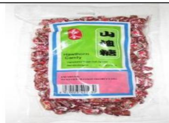
Caramelo de espino Retirado el: 3 de octubre de 2008