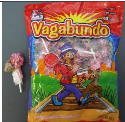
Paletas de dulces Vagabundo Retirado el: 30 de marzo de 2012