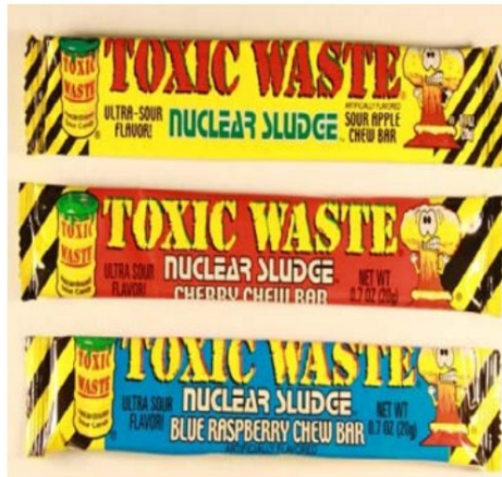
Barra de lodos nucleares de la marca Toxic Waste (varios sabores) Tenga en cuenta: el retiro extendido solo se aplica a los caramelos Nuclear Sludge y no a otros caramelos de la marca "Toxic Waste". Retirado el: 14 de enero de 2011