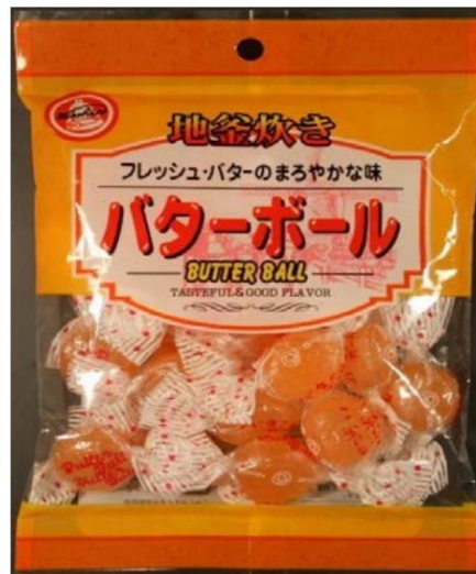
Caramelos de bola de mantequilla Retirado el: 13 de diciembre de 2010

LA INFORMACIÓN CONTENIDA EN ESTE DOCUMENTO ESTÁ SUJETA A CAMBIOS FRECUENTES SIN PREVIO AVISO. Esta información es válida únicamente a partir de la fecha de "Última actualización" que figura en la parte superior de la página, y solo hasta la próxima actualización. Las medidas de cumplimiento adoptadas únicamente con base en la información contenida en este documento podrían no ser válidas.