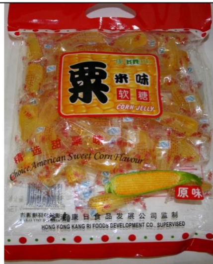
Jalea de maíz / Maíz dulce americano selecto Sabor retirado del mercado el 4 de mayo de 2010