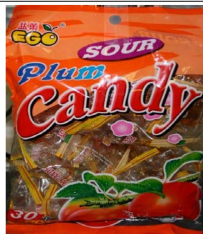
Caramelo de ciruela ácida Ego/ Importado de Malasia Retirada del mercado el 3 de noviembre de 2010

LA INFORMACIÓN CONTENIDA EN ESTE DOCUMENTO ESTÁ SUJETA A CAMBIOS FRECUENTES SIN PREVIO AVISO. Esta información es válida únicamente a partir de la fecha de "Última actualización" que figura en la parte superior de la página, y solo hasta la próxima actualización. Las medidas de cumplimiento adoptadas únicamente con base en la información contenida en este documento podrían no ser válidas.