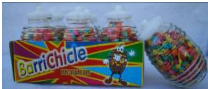
Chicle BarriChicle Retirado el: 11 de marzo de 2008

LA INFORMACIÓN CONTENIDA EN ESTE DOCUMENTO ESTÁ SUJETA A CAMBIOS FRECUENTES SIN PREVIO AVISO. Esta información es válida únicamente a partir de la fecha de "Última actualización" que figura en la parte superior de la página, y solo hasta la próxima actualización. Las medidas de cumplimiento adoptadas únicamente con base en la información contenida en este documento podrían no ser válidas.