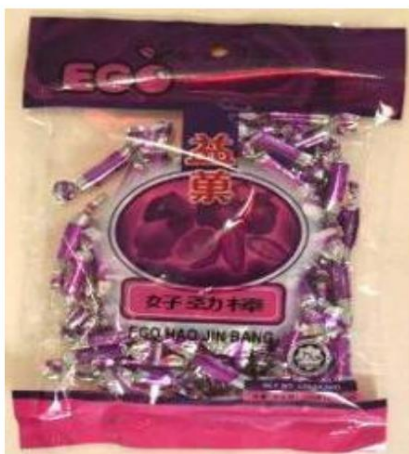
Ego Hao Jin Bang Retirado el: 31 de julio de 2008