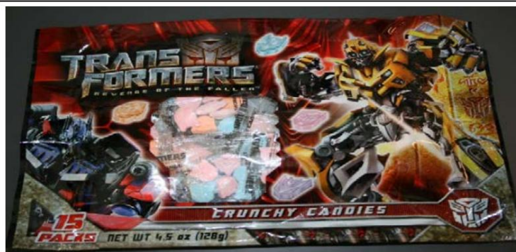
Au'SomeTrans Formadores 'La venganza de los caídosTM' Caramelo crujiente Vigente a partir del 28/09/2010 Este dulce ESTÁ PERMITIDO PARA LA VENTA EN California, EXCEPTO LOTE # 09168 Retirado el: 6 de agosto de 2010