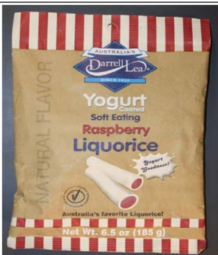
Yogur suave recubierto Darrell Lea de Australia Comer regaliz de frambuesa Retirado el: 17 de marzo de 2010