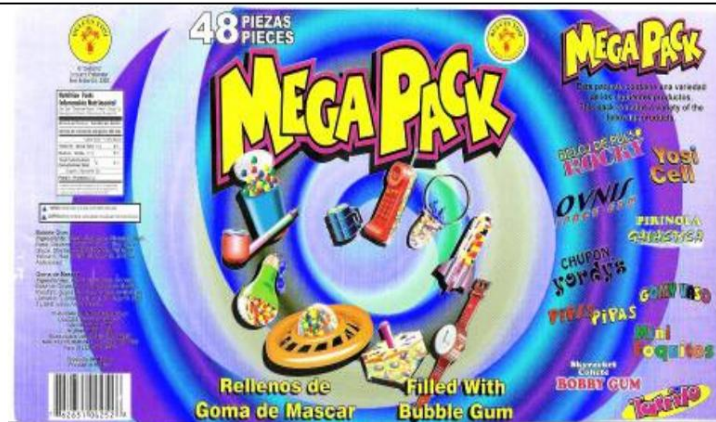
Nueva etiqueta de dulces

Dulces Beny Mega Pinta Labios A partir del 5 de octubre de 2009: este dulce con fecha de caducidad de enero de 2009 o posterior está permitido para la venta en California.