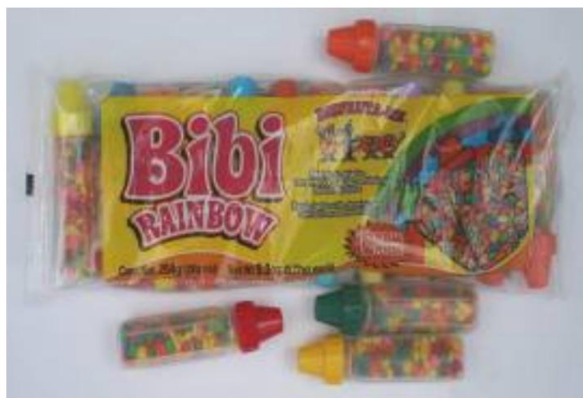
Chicle Bibi Arcoiris Retirado el: 6 de febrero de 2008