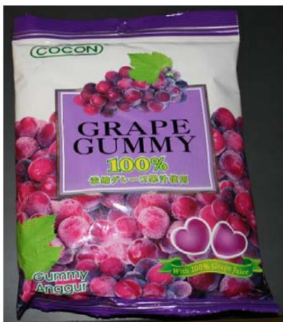
Gomitas de uva Cocon® 100% caramelo Retirado el: 27 de agosto de 2010

Foto de Candy / Nombre y enlace del comunicado de prensa