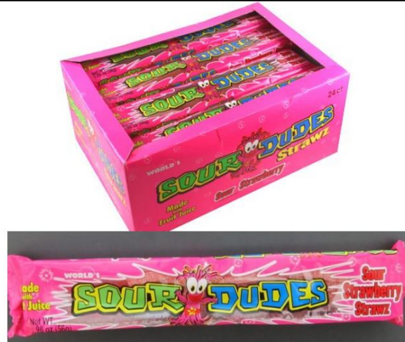
Los tipos ácidos del mundo Fresa ácida Retirada de Strawz el 30 de agosto de 2012

LA INFORMACIÓN CONTENIDA EN ESTE DOCUMENTO ESTÁ SUJETA A CAMBIOS FRECUENTES SIN PREVIO AVISO. Esta información es válida únicamente a partir de la fecha de "Última actualización" que figura en la parte superior de la página, y solo hasta la próxima actualización. Las medidas de cumplimiento adoptadas únicamente con base en la información contenida en este documento podrían no ser válidas.