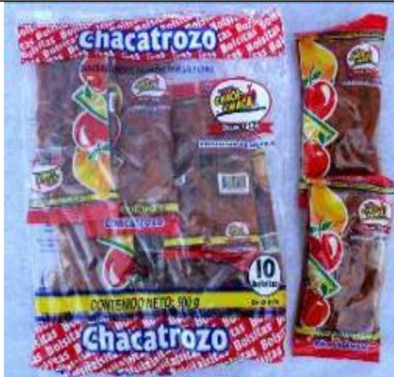
Chaca Chaca Chacatrozo Retirado el: 17 de abril de 2008

Foto de Candy / Nombre y enlace del comunicado de prensa