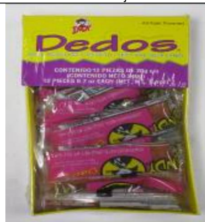
Indy Dedos, picante y ácido A partir del

19/12/07: este dulce con un código de lote de dos líneas podrá venderse en California.