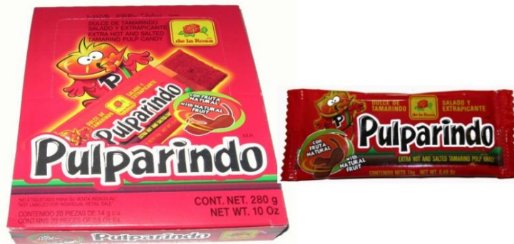
De La Rosa Pulparindo (Extra Hot)