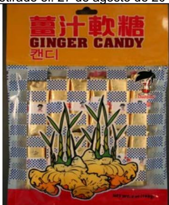
Caramelos de jengibre DaiJyo Bu de China Retirado el: 21 de septiembre de 2010