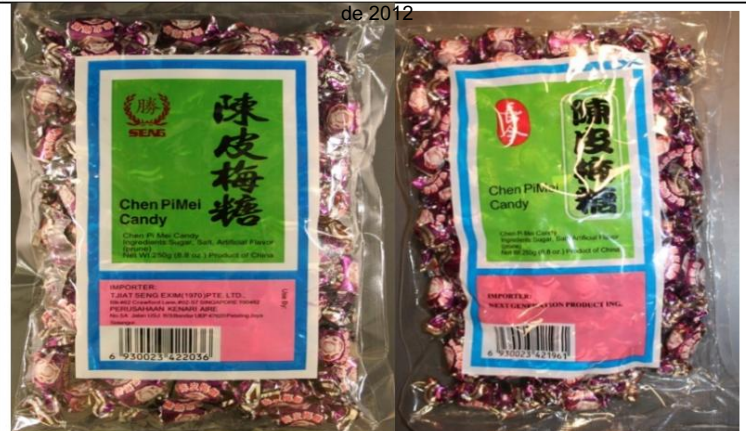
Caramelos Chen Pi Mei y Caramelos SENG Chen Pi Mei Retirado el: 31 de diciembre de 2009 / Retirado el: 6 de junio de 2009

LA INFORMACIÓN CONTENIDA EN ESTE DOCUMENTO ESTÁ SUJETA A CAMBIOS FRECUENTES SIN PREVIO AVISO. Esta información es válida únicamente a partir de la fecha de "Última actualización" que figura en la parte superior de la página, y solo hasta la próxima actualización. Las medidas de cumplimiento adoptadas únicamente con base en la información contenida en este documento podrían no ser válidas.