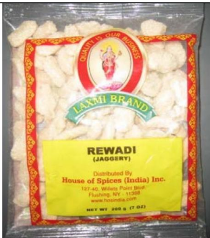
Laxmi Brand Rewadi (Jaggery)/ de la India Retirado el: 16 de febrero de 2012

Foto de Candy / Nombre y enlace del comunicado de prensa