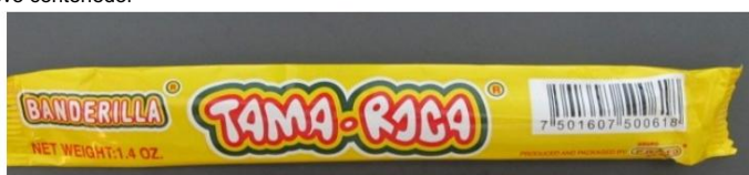
Tama Roca Banderilla