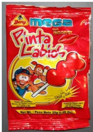
Nombre y enlace del comunicado de prensa

Última actualización: 9 de noviembre de 2013