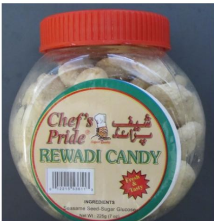
Dulces Rewadi Chef's Pride/ Importados de Pakistán retirado del mercado el 5 de marzo de 2012