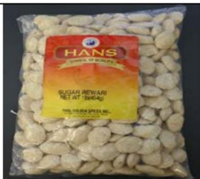
Hans Sugar Rewari / Importado de la India Retirado el: 17 de noviembre de 2011

Foto de Candy / Nombre y enlace del comunicado de prensa