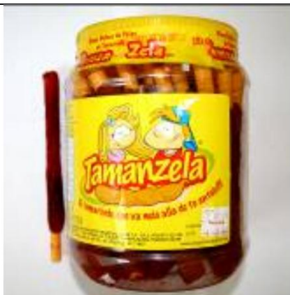
Tamanzela, piruleta cubierta de chile

Lollipop retirado del mercado el 11 de marzo de 2008