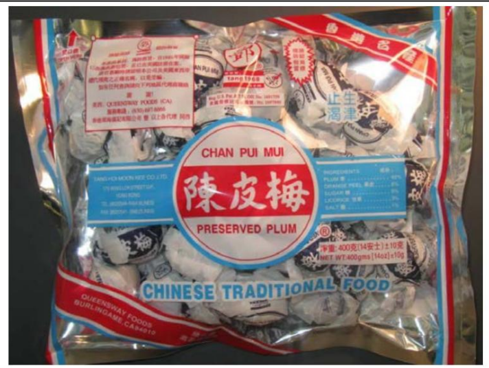
Chan Pui Mui/ De Hong Kong retirado del mercado el 16 de octubre de 2012