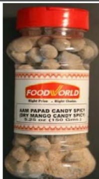
Caramelo de mango picante Papad Por Food World Retirado el: 1 de julio de 2010

Foto de Candy / Nombre y enlace del comunicado de prensa