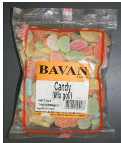
Mezcla de marca BAVAN desnuda Retirado el 1 de diciembre de 2011